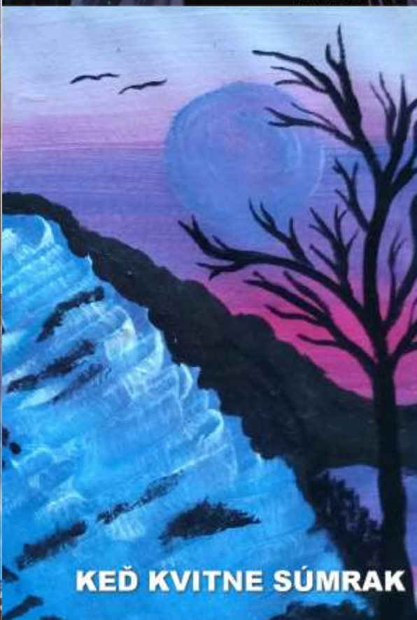
KEĎ KVITNE SÚMRAK