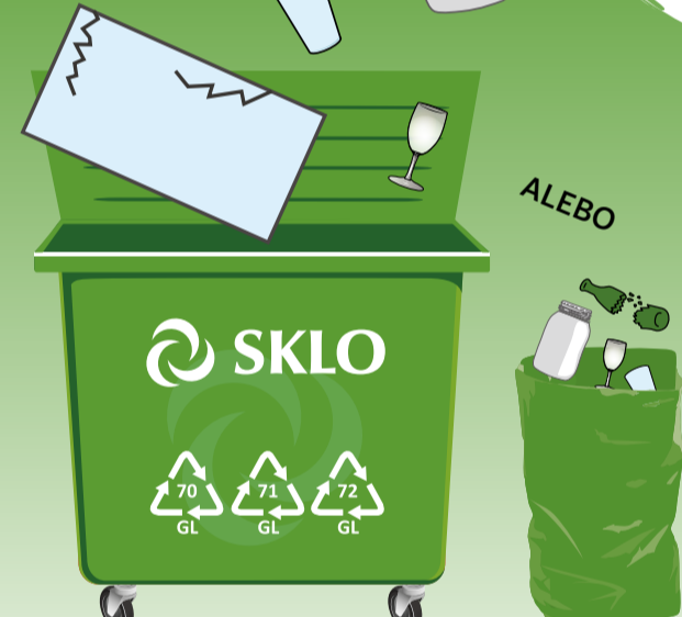
PODĽA SYSTÉMU ZBERU VO VAŠEJ OBCI

30 plastových fliaš sa zmení na fleecovú bundu?