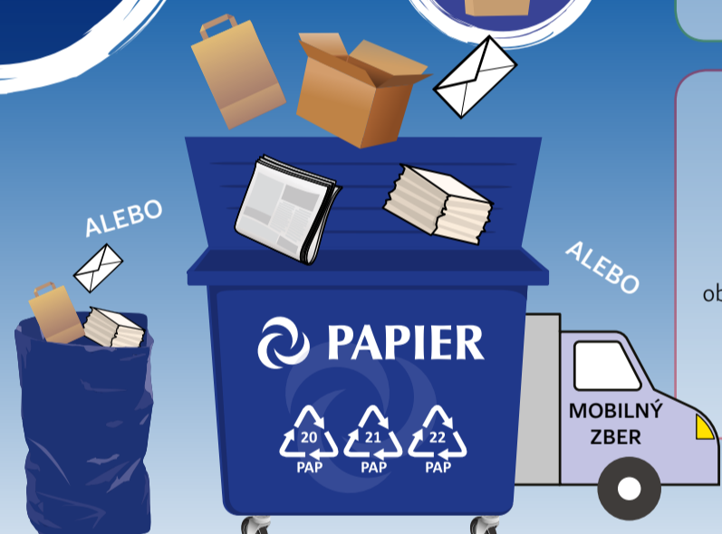
PODĽA SYSTÉMU ZBERU VO VAŠEJ OBCI