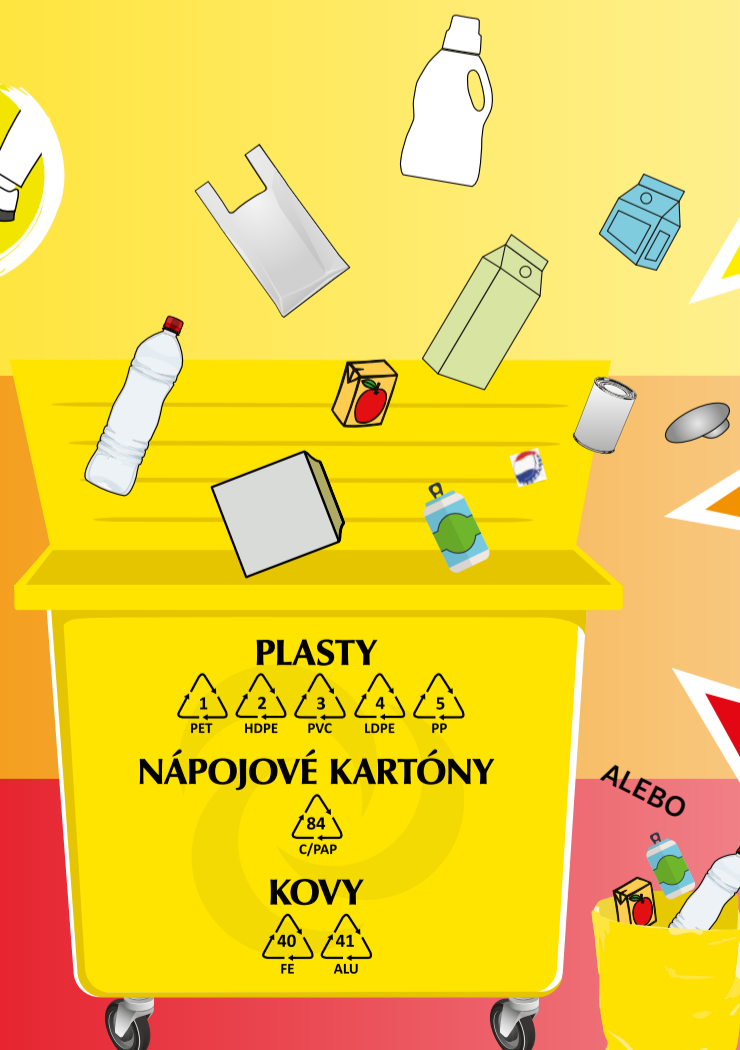
PODĽA SYSTÉMU ZBERU VO VAŠEJ OBCI