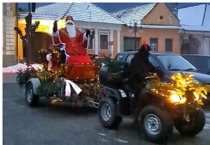
V podvečer 5. decembra zavítal do našej obce sv. Mikuláš so svojimi pomocníkmi, aby navštívil a obdaroval deti sladkosťami.