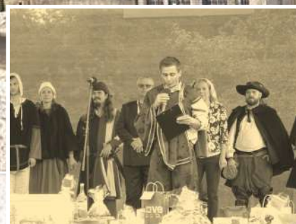
Štítnické hradné hry na str. 12