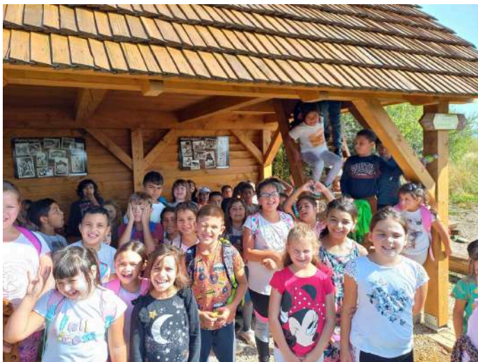
Náučný chodník v Rejdivovej

V uplynulých mesiacoch sme uskutočnili množstvo školských podujatí. V rámci prvých týždňov žiaci 2. stupňa absolvovali účelové cvičenie zamerané na rozvoj zručností a vedomostí žiakov v oblasti ochrany života a zdravia počas mimoriadnej situácie. Zrealizovali sme turistické vychádzky, žiaci 1. stupňa využili nádherné počasie na turistickú vychádzku za krásami rejdivského náučného chodníka v Revúckej vrchovine a žiaci 2. stupňa absolvovali turistiku na Zúgó.