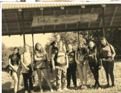
Život v našej škole na str. 10