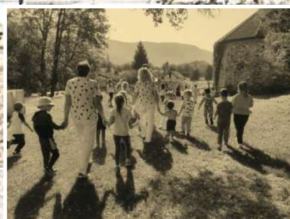
Zo života materskej školy na str. 8