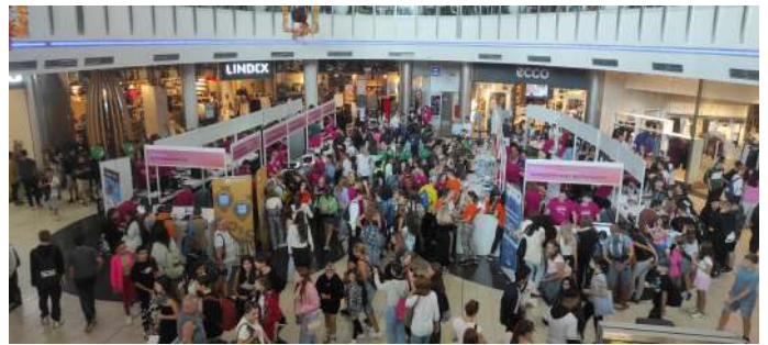
Noc výskumníkov v OC Optima

29. septembra 2023 sa žiaci 2. stupňa zúčastnili 17. ročníka Európskej noci výskumníkov v košickej Optime. Noc výskumníkov interaktívnym spôsobom šíri vedecké poznatky a objavy, približuje výskum a inovácie širokej verejnosti.