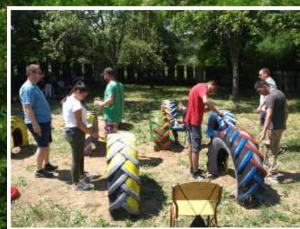
Zo života základnej školy...na strane 11