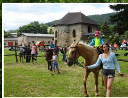
Deň detí... na strane 9