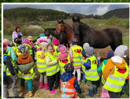
Zo života materskej školy ... na strane 5