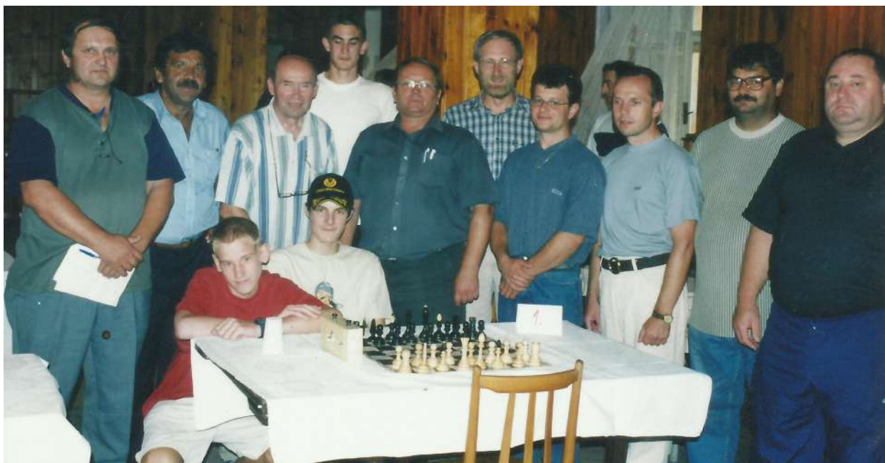
Ilustračná fotka z archívu šachového oddielu.