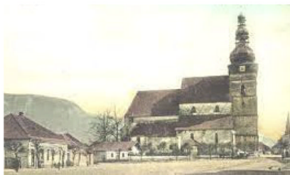
Pohľad na námestie z konca 19. a začiatku 20. storočia

Školský rok slávnostne započal dňa 1. augusta.