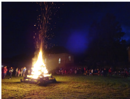
Vatra SNP v areáli "Vodného hradu".

Tradičnú vatru sme zapáli v areáli "Vodného hradu", kde sa niektorí mohli občerstviť vínom a dobrou hubou, ktorú nám sprostredkovala rómska skupina zo Slavošoviec. Stánok s občerstvením ponúkal cukrovú vatu, palacinky, nealko a čapované pivo. Dobrá nálada nám vydržala do neskorých nočných hodín.