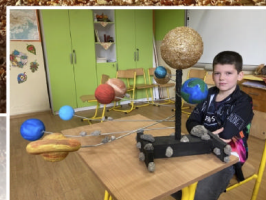
Život v našej škole na str. 12