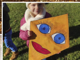
Zo života materskej školy na str. 6