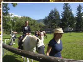
Rozlúčka s letom na str. 8